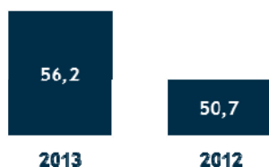
Tráfego Pedagiado Veículos Equivalentes (milhões)